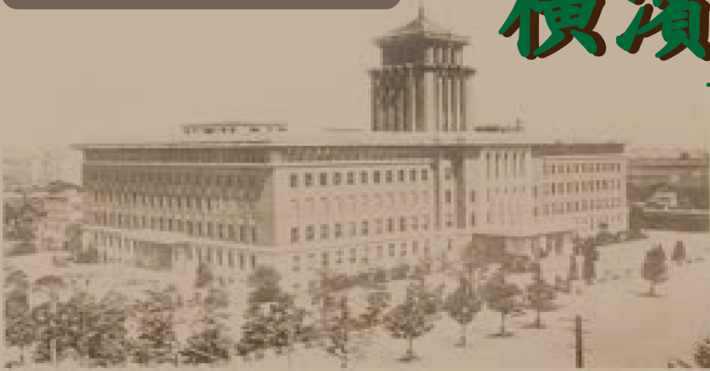
神奈川県立公文書館