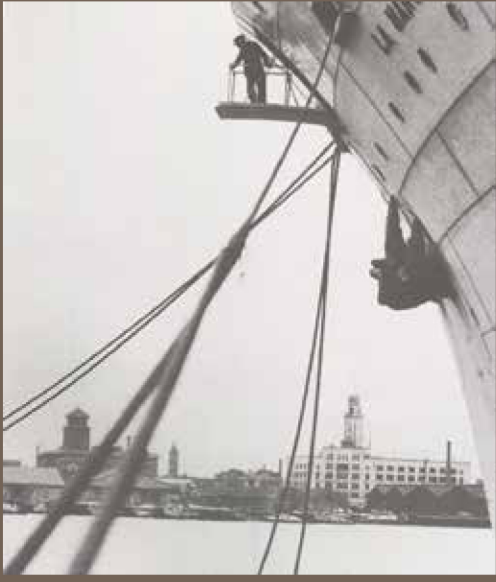
公文書館所蔵資料：「神奈川県廳物語」 (平成元年、神奈川県)より