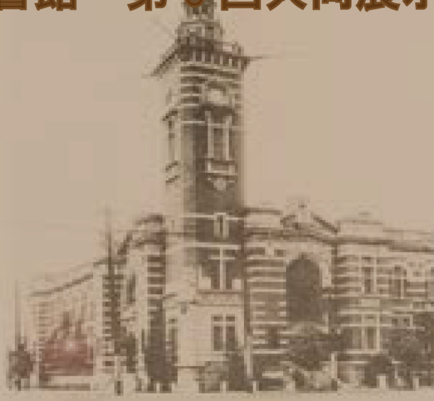
神奈川県立公文書館