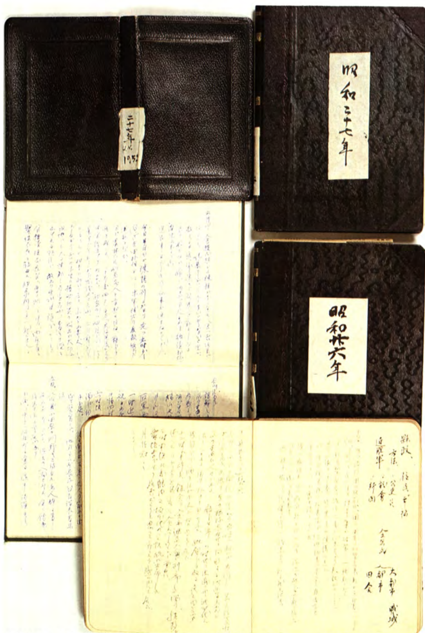
戦後県政で重要な役割を果たした内山岩太郎知事の『日記』