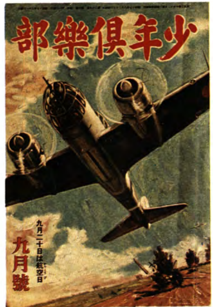
戦意高揚をはかった雑誌・百人一首