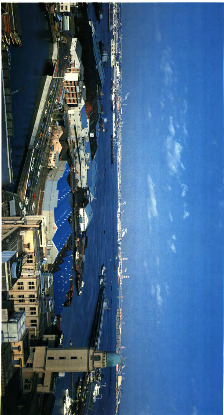
県庁屋上からみた鶴見・川崎の工場地帯