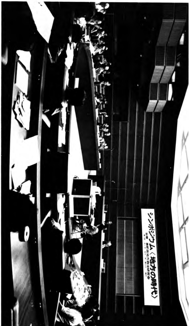
第1回「地方の時代」シンポジウム —1978年7月14・15日に開かれた—