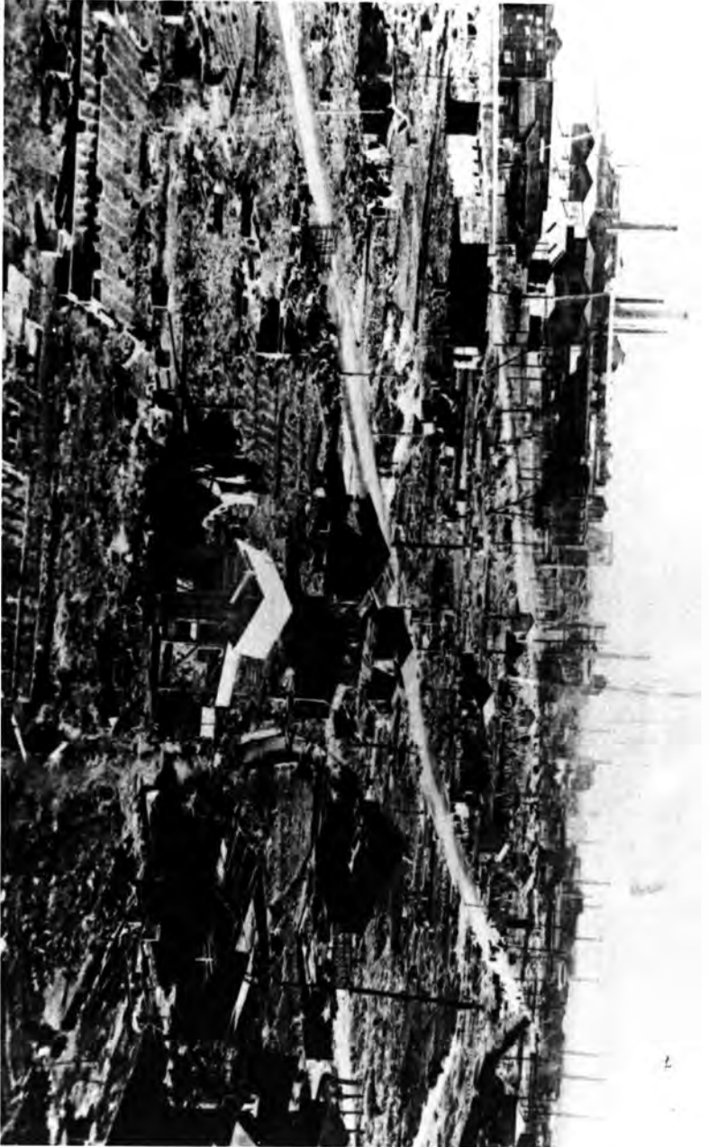
川崎市内の戦災状況