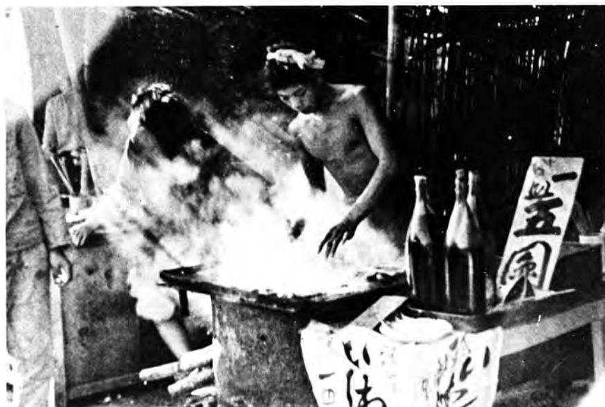
敗戦直後の住宅難(上)と食糧難(下)の状況