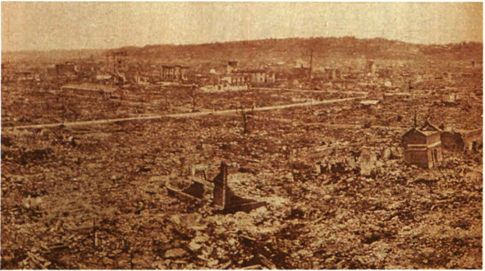
焦土となった横浜市街 —上は海岸寄り・下は山の手方面— 『大震災写真画報』から