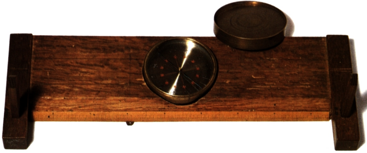
地積測量器具 小林英男氏蔵