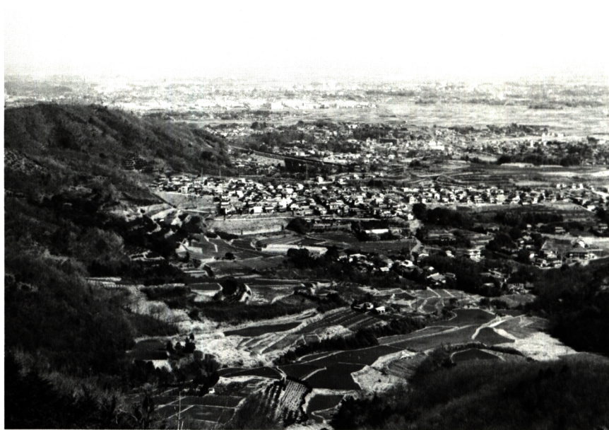
弘法山山頂からの眺望

愛甲郡荻野村(現在厚木市)に結成された民権結社「講学会」の集會に 旅籠辰巳屋の岡持で仕出し弁当が用意された