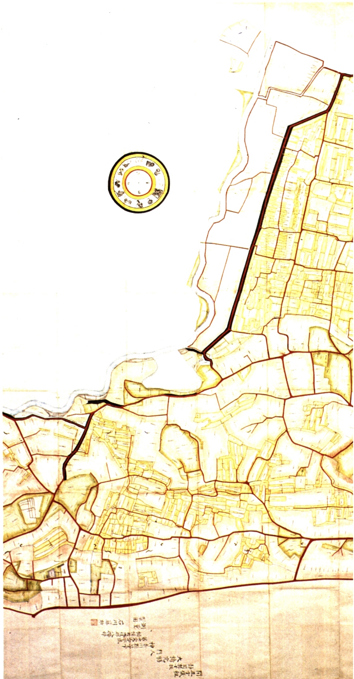
地租改正時の真土村地引絵図