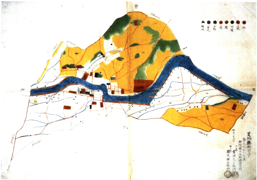
南金目村絵図 1875(明治8)年 上野敏子氏蔵

南金目村は現在平塚市 大区小区制が実施されるに従って 各村ごとにこのような絵図が作られた