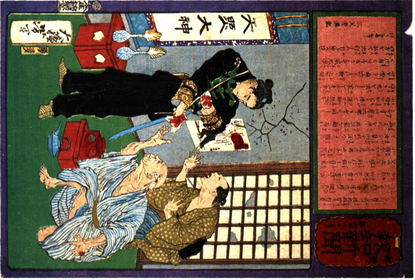
子の徴兵に子指を切つて励ます 図 古江亮仁蔵