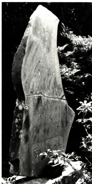
露木事件関係者の供養塔 大磯町西長院境内